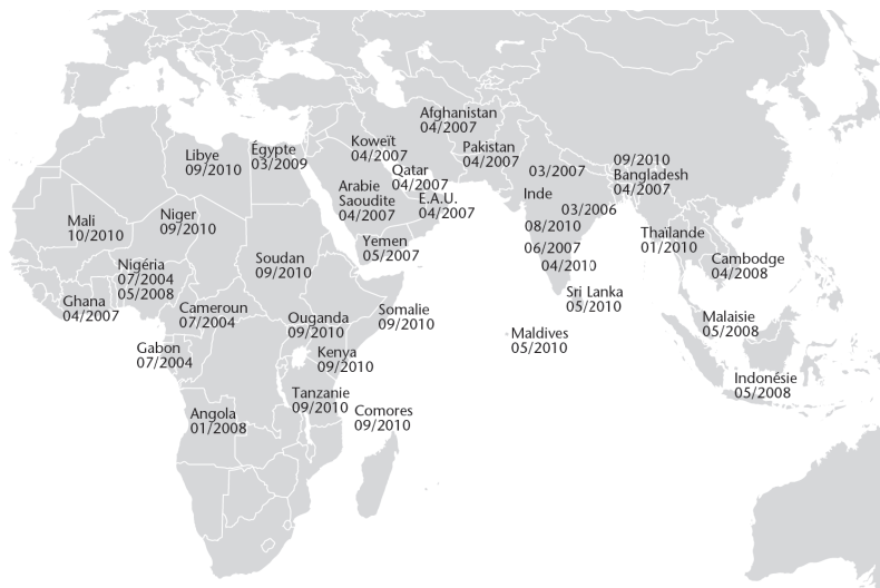
Carte 1 – Diffusion de la rumeur des numéros tueurs (2004-2010)